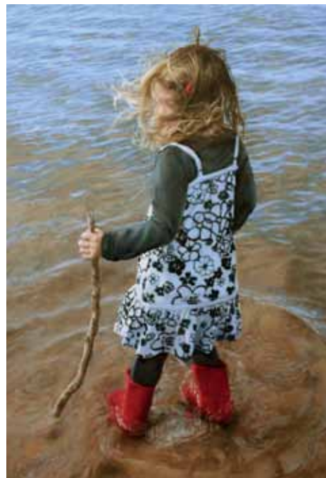
Ralf Heynen, 'Baadster', 2013. Olieverf. 60 x 80 cm. Te zien bij Galerie Terbeek op Art Laren.

Art Laren Brink Laren www.artlaren.nl 14-06 t/m 16-06