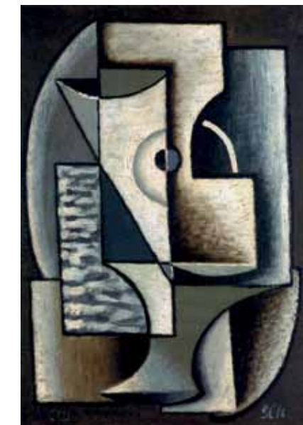
Serge Charchoune (1888-1975): 'Cubisme ornamental n° 10', 1922. Olieverf op doek, gemaroufleerd op paneel, 34 x 24 cm. Te zien bij Galerie Applicat-Prazan, tijdens de Nocturne Rive Droite.

Nocturne Rive Droite Faubourg Saint-Honoré tot Avenue Matignon Parijs www.art-rivedroite.com 05-06