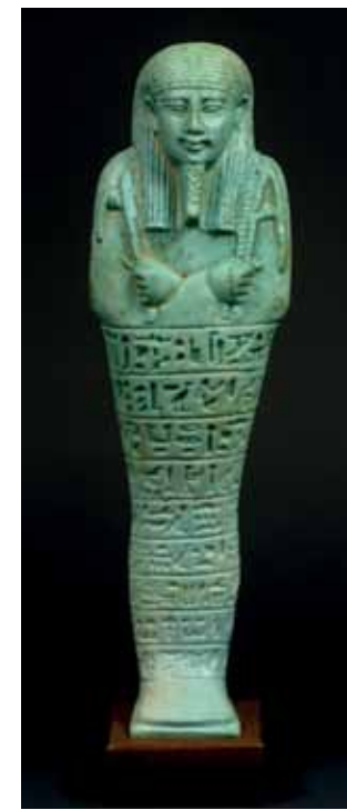
Votiefbeeld van een vrouw. Oostelijk Mediterraan gebied, derde/vierde eeuw. Been, goud en een parel. Hoogte 19,6 cm. Herkomst: Houshang Mahboubian collection, VK. Te zien bij Anubis Ancient Art, Henk Dijkstra, tijdens BRUNEAF.

Haagsche Kunst- en Antiekdagen, Lange Voorhout, Denneweg en Noordeinde, Den Haag, www.hkad.nl, 24-08 t/m 25-08