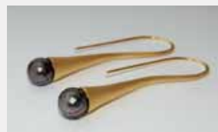
Een paar oorbellen, met in facet geslepen groene Zuidzeeparels. Deze waren een enorm succes bij Bol & de Bruijn Edelsmeden (Rosmalen), op de Art & Antiques Fair 's-Hertogenbosch.