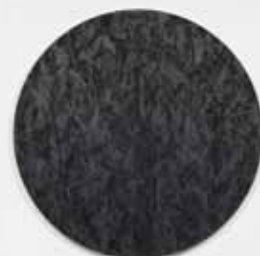
Adam McEwen: 'Untitled', 2012. Grafiet op aluminium. Diameter 45,72 cm. Verkocht bij Galerie Rodolphe Janssen aan een Belgische verzamelaar, op Art Brussels.